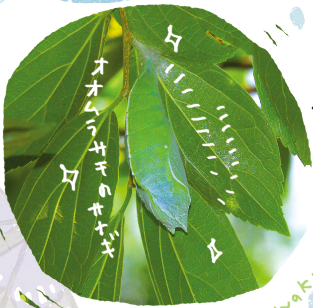
オオムラサキのサナギ