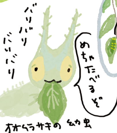
オオムラサキの 幼虫

榎の葉は 枝を切ると すぐしおねしまうので 土にはえている木の枝に 袋をつけて観察しよう!!