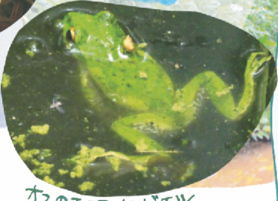
オスのモリアオガエル